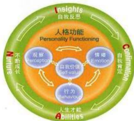
ICAN 实践心理学模式图

“ICAN”实践心理学模式是黄重光根据精神科医学和心理学，及多年的临床工作与培训医学、教育和工商界等专业所得之经验，创立的一个以科学为本，价值为基础的实践心理学模式（如下图），目的是提升个人和整体社群的心理素质。