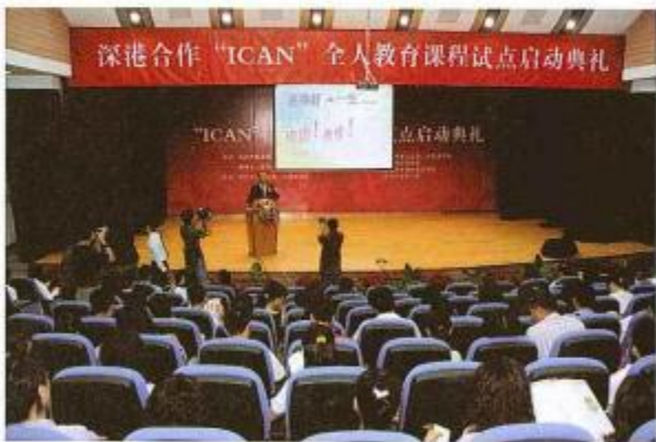
深圳教育局与全人教育基金合作“ICAN全人教育”课程试点启动仪式。

据黄重光介绍，其中有一个很好的例子是，英国政府在2006年推出的“推广心理治疗”（The Improving Access to Psychological Therapies, IAPT）计划。这个计划的推广目标是针对英国六百万患有焦虑病和忧郁病的成年人。据英国政府当时的统计，这六百万患病人口只有四分之一得到治疗。因此，英国政府希望通过“推广心理治疗”计划，让更多的病患者得到治疗。